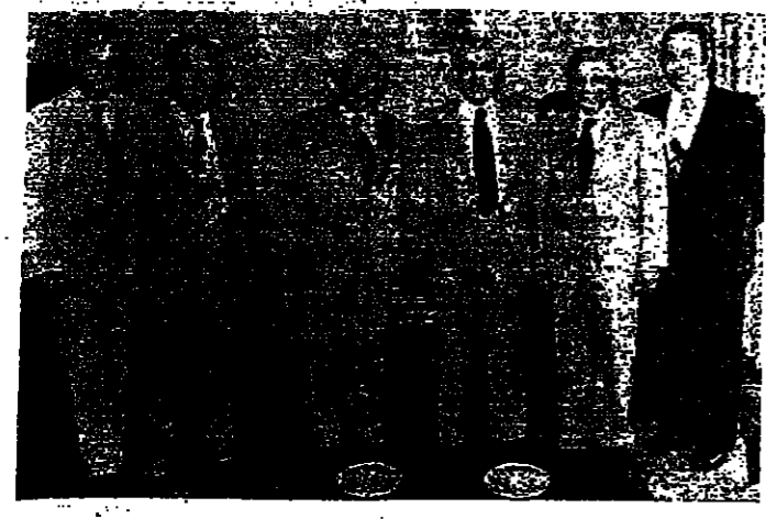
الرئيس عسيران يحيط به رئيس جمعية التجار السيد جبريل عسيران ووفد التجار

ابلق امس وزير الاقتصاد والتجارة الرئيس عادل عسيران جمعية تجار بيروت، انه تقرر بمؤتمر نهائي احتساب اسعار بطلقات السفر واجور الشحن، على اساس السعر الحالي للدولار الأمريكي.